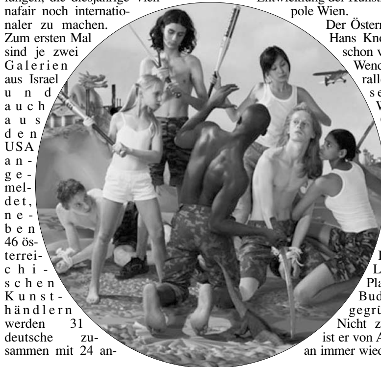
Gruppe AES+F: Last Riot 2, Tondo (2005) Fotodruck auf Leinwand