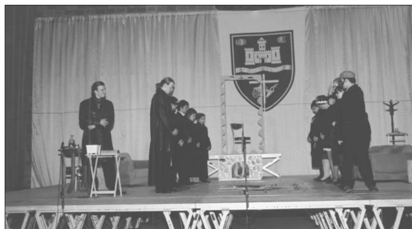
Deutsches Nationalitätengymnasium Budapest