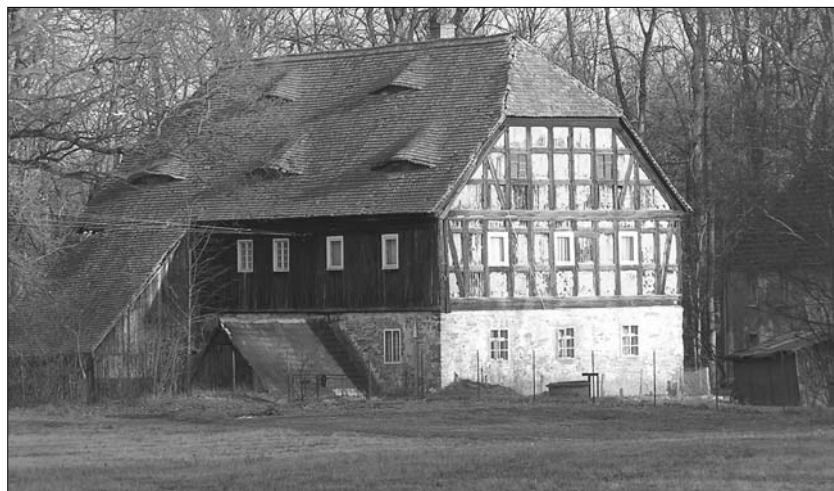
Die Mühle von Halbendorf