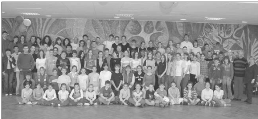
Teilnehmer des Tanzlagers in Bonnhard

Manchmal möchte man nur einen neuen Tanz erlernen oder eben in guter Gesellschaft von Gleichgesinnten einige Tage auf dem Tanzparkett verbringen. Ihnen allen bot das 12. Ungarndeutsche Tanzlager in Bonnhard am 31. März und 1. April eine gute Möglichkeit, dies zu tun. Über 80 Tanzfreunde nutzten die Chance.