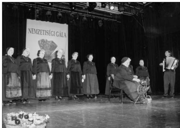
Der Willander Frauenchor

Acht Persönlichkeiten und Gemeinschaften erhielten heuer am vergangenen Sonntag die hohe Anerkennung für verdienstvolle Pflege der Kultur der Minderheiten in Ungarn. Für ihre jahrzehntelange standhafte, erfolgreiche und hervorragende kulturelle Arbeit wurde der 35jährige Willander Frauenchor ausgezeichnet. Der Willander Frauenchor zählt seit Jahrzehnten zu den bekanntesten und beliebtesten Singgemeinschaften im Komitat Branau. In den