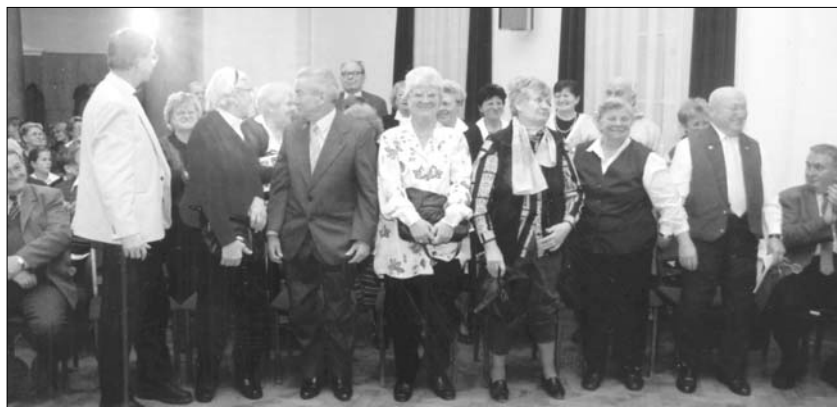
Mitglieder des Schorokscharer Deutschklubs beim Festakt