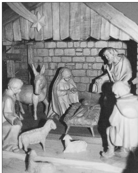
Krippe Jaksch. (Lesen Sie dazu den Beitrag auf Seite 6!)

Die Stiftung und Redaktion Neue Zeitung wünschen den Lesern, Freunden und Förderern frohe Weihnachten und ein erfolgreiches Neues Jahr!