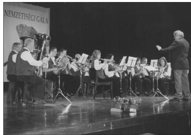
Das Bogdaner Schwabenorchester

vergangenen 35 Jahren haben die Sängerinnen mit ihren außergewöhnlich schönen Stimmen sowohl in Ungarn als auch im Ausland große Erfolge geerntet. Der Chor erneuerte sein Repertoire ständig, das auf alten deutschen Sammlungen basiert. Nun sind aber mehrere Mitglieder in die Jahre gekommen, die