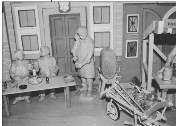
Krippenszene „Der Weinhändler“

Eine Besonderheit sind zahlreiche Figuren, die erkennbar nach lebenden Persönlichkeiten geschnitzt wurden. Da finden sich die verschiedenen Bürgermeister von Waidhofen, Handwerker, Gewerbetreibende, vieles, das für diese Gegend im Waldviertel typisch ist oder war: der Bandlkramer von Groß-Siegharts, der Sautreiber von Thaya, die Flachs-Spinnerin der früheren „Haarstubb“,