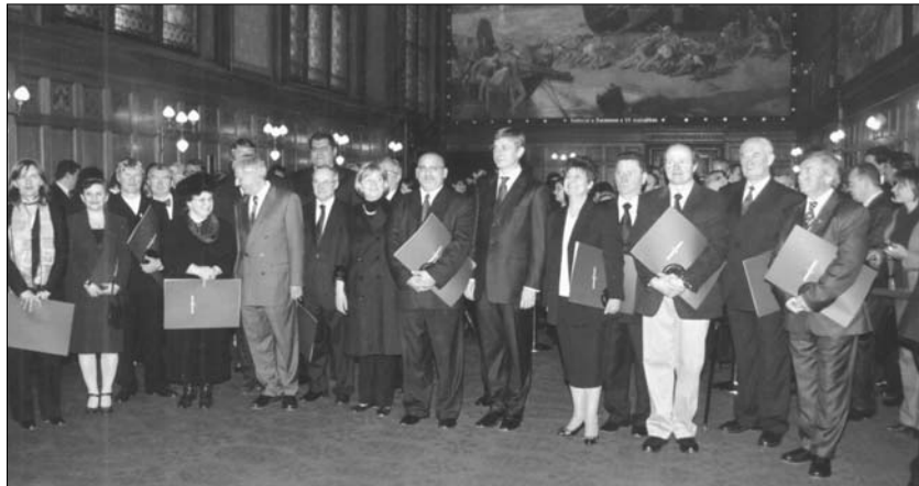
Die Ausgezeichneten mit Staatspräsident László Sólyom, Parlamentspräsidentin Katalin Szili und Ministerpräsident Ferenc Gyurcsány

16 Personen und Gemeinschaften, die in unterschiedlichen Bereichen des Lebens der Minderheiten in Ungarn und der Ungarn im Ausland Hervorragendes geleistet haben, konnten am 18. Dezember den Minderheitenpreis des Ministerpräsidenten im Jägersaal des Parlaments übernehmen. Im Beisein von Staatspräsident Sólyom, Parlamentspräsidentin Szili und zahlreichen hochrangigen Persönlichkeiten würdigte Ministerpräsident Gyurcsány die Tätigkeit der Geehrten. Heuer befanden sich auch Ungarndeutsche unter den Ausgezeichneten.